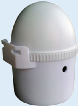
Sinaleiro de porta